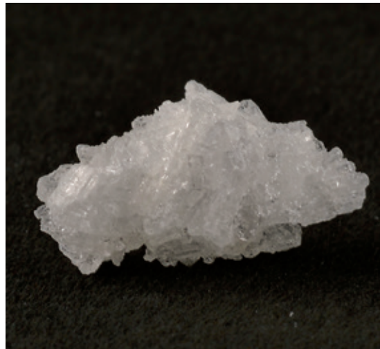
^ Kristallines Methamphetamin („Crystal Meth“) in typischer Erscheinungsform